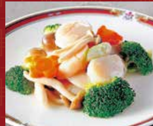
帆立貝柱と季節野菜炒め