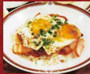
今治B級グルメ 焼豚玉子飯