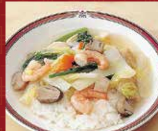
魚介入りあん掛けご飯