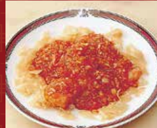
エビのチリソース