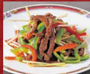
牛肉とピーマンの細切り炒め