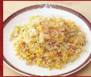
カニ肉入りレタス炒飯